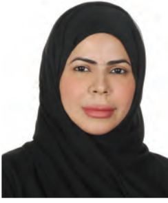
فاطمة المزروعي - أديبة إماراتية