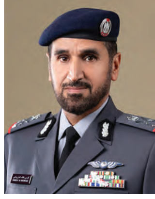
اللواء الركن فارس خلف المزروعجي

وأشار معاليه إلى أن الحفاظ على الأمن والاستقرار وتوفير السلامة هو مسؤولية لا ينهض بها رجال الشرطة وحدهم، وإنما هي مسؤولية مشتركة بين الشرطة وأفراد المجتمع، وأن ينهض الجميع بدوره في هذه المسؤولية من خلال الالتزام بالقانون والتعاون مع القائمين على تنفيذه.