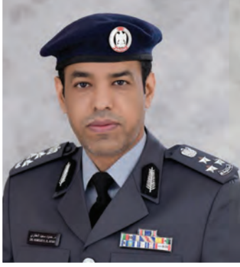
العميد الدكتور حمود سعيد العفاري مدير إدارة الشرطة المجتمعية - شرطة أبوظبي